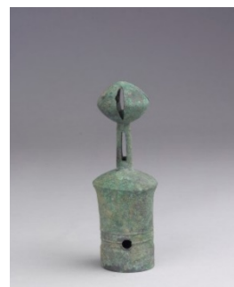
殷墟出土的球鈴軛首

這種形制的鑾有些學者認為出現於西周，也有學者認為在殷墟晚期。因為在殷墟已有鑄接球形鈴的軛首，這應是源自於北方式文化的鈴首管鑒器。殷墟的球鈴軛首飾到了晚期即演變成濬縣辛村出土的鑾鈴。