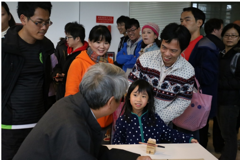
（小朋友，說說看你想要甚麼句子呢？）

活動進行中，李老師用心解說文字及揮毫，排隊的人也不閒著，忙著用手機查詢想要的文句能否用甲骨字寫出來，或者能否換句話說……全場有一種腦細胞啾啾跳動的感覺！我們一起認識一下當天腦筋急轉彎的成果吧！