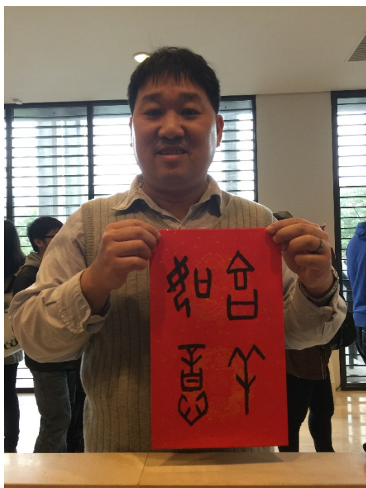
甲骨文「吉羊(祥)如意」