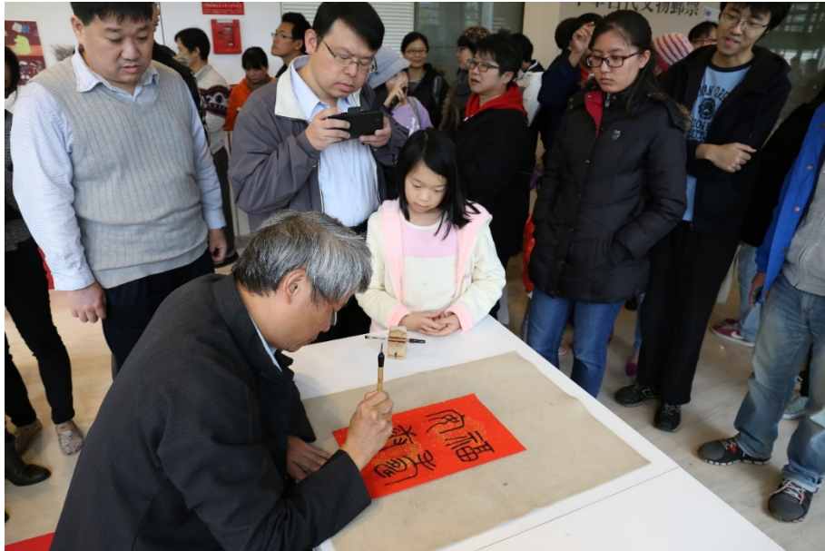
（第一張春聯，篆書「福壽安康」。）

下午三點零四分，登！登！登！第一張春聯完成，篆書「福壽安康」！雖說春聯活動是以「甲骨文」為主打，但在甲骨文裡，有些字還沒有出現，又或者考量斗方（方形春聯紙）的空間佈局，李老師會選用篆、隸、楷、行、草其他字體來表現。