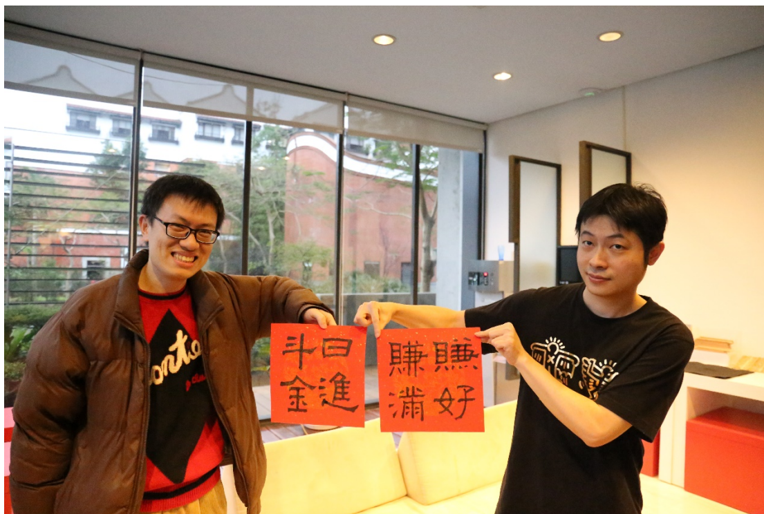
（兩位帥哥的事業立志語！隸書「賺好賺滿、日進斗金」。）