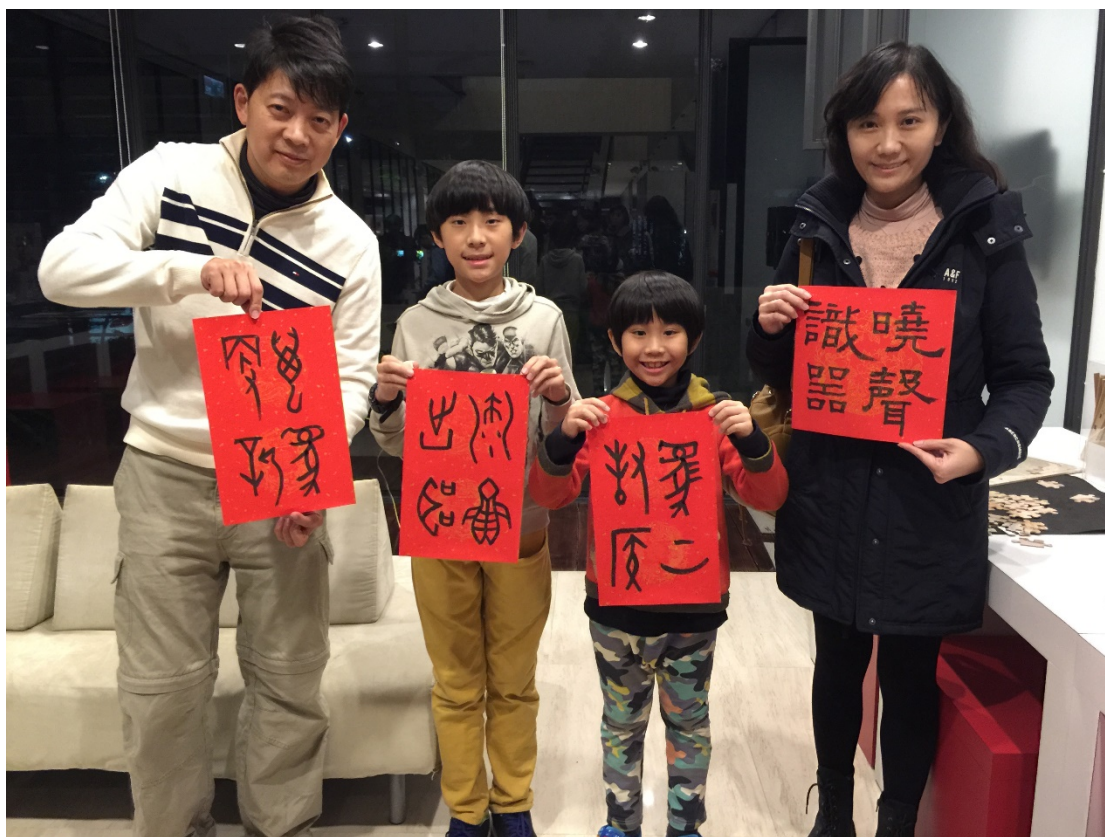
（爸爸媽媽帶著兩個小朋友排隊排到六點多喔！從媽媽至爸爸：隸書「曉聲識器」、甲骨文「馬上封侯」、「沈魚出聽」及「萬象更新」。）