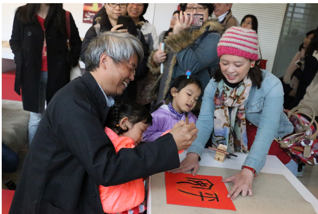
（耶！篆書「平安」完成了！）