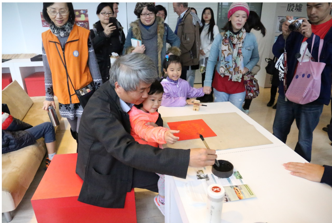
（先將毛筆沾墨，老師帶你一起寫。）