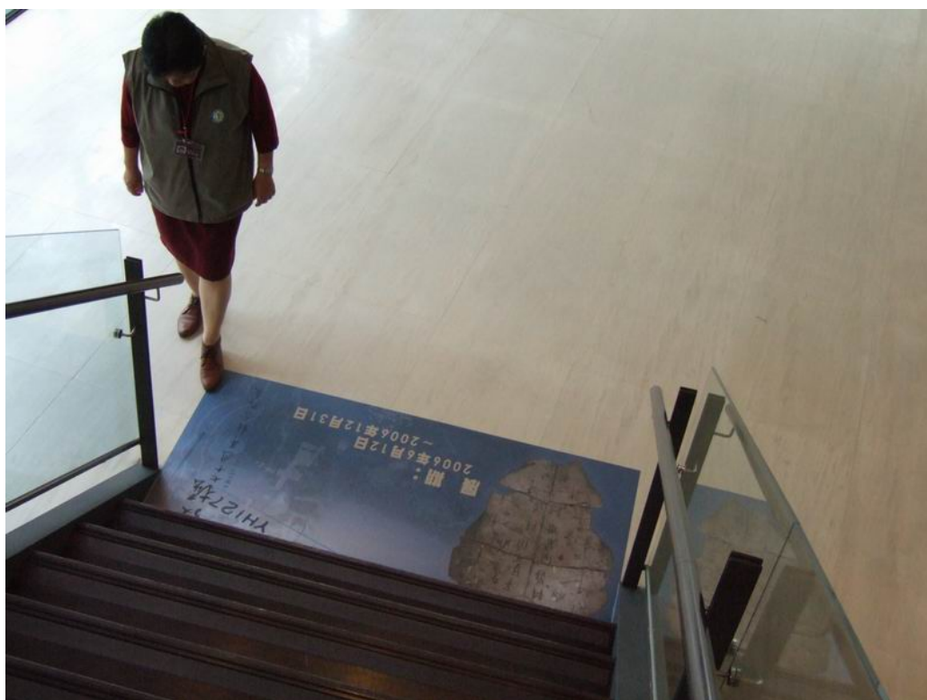
本館大廳樓梯口擺設特展踏墊，引導觀眾上樓參觀甲骨特展區。