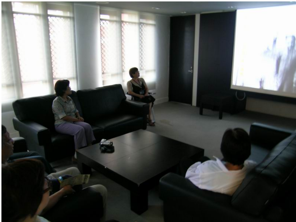
特展短片：介紹 1880 年以來甲骨的發現、流落國外、確認，以及本所進行科學發掘的過程。