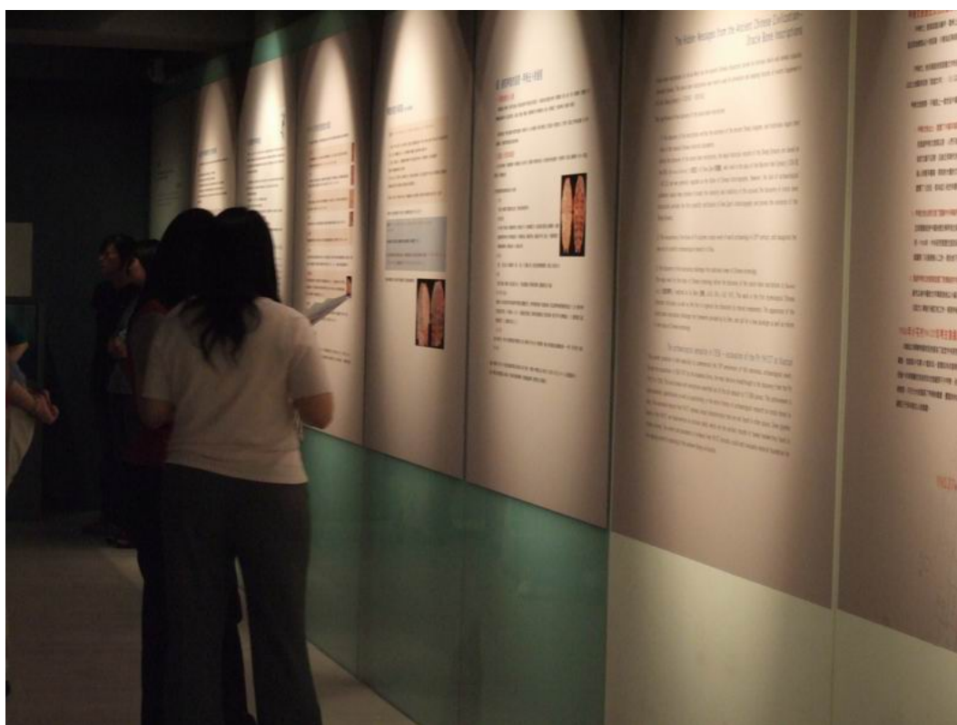
牆面看板文字：以圖文詳盡地說明本次特展的內容與特色。