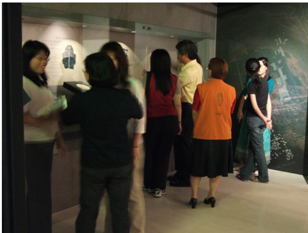
參觀者與導覽者熱烈的對話。