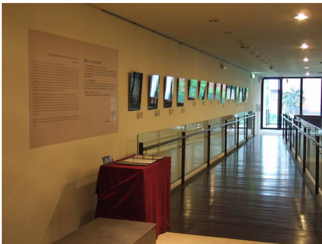
重溫發掘時刻：利用 YH127 黑白老照片展示當時考古家如何進行發掘，以及遇到困難時又如何解決問題的。小桌上陳列當時的發掘田野紀錄表（複製件）。