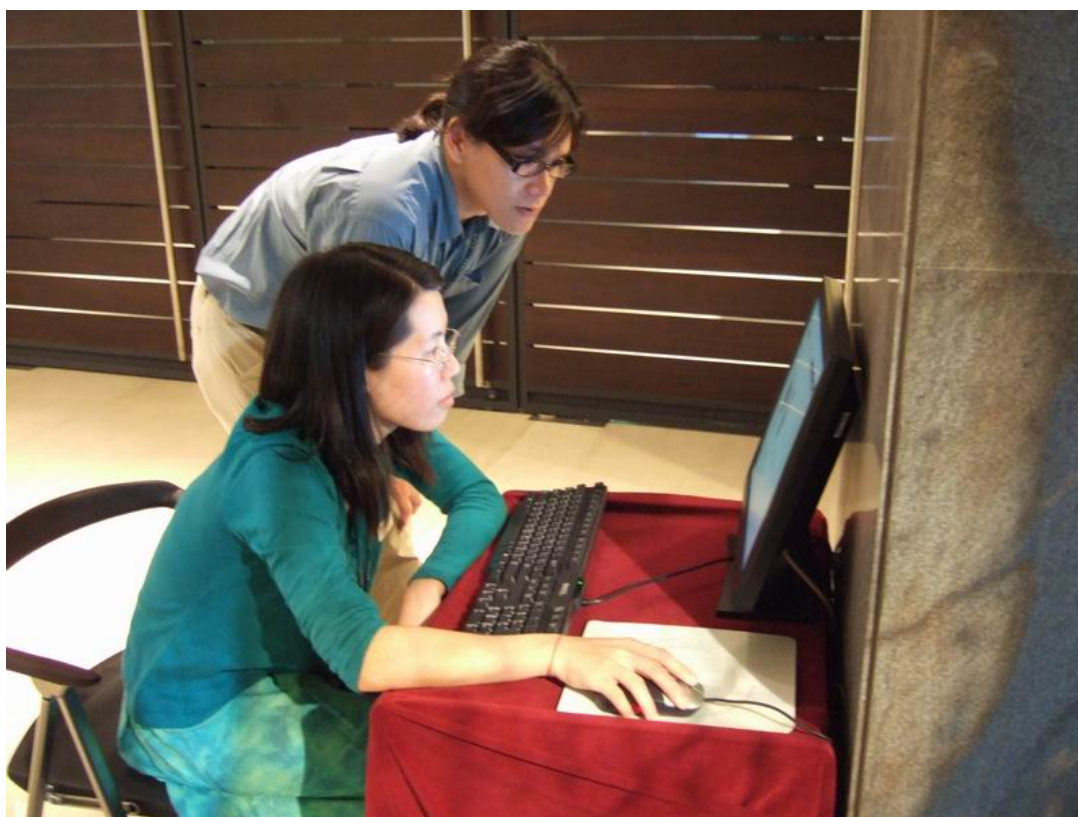
展區入口處設置資料庫查詢系統，提供參觀者查詢史語所考古數位典藏資料庫。及甲骨文資料庫，這包括 YH127 出土的甲骨資料。