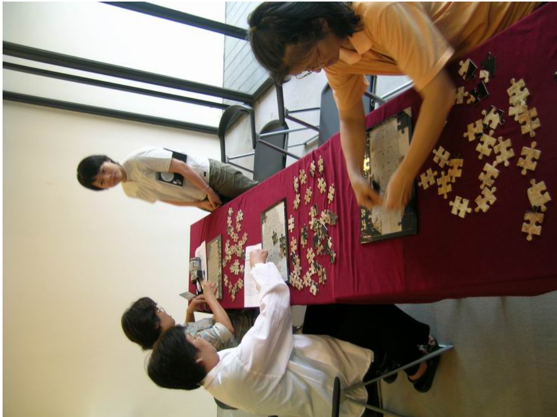
甲骨拼圖：大家一起來拼圖，感受一下甲骨學家如何將碎裂的甲骨綴合起來的。