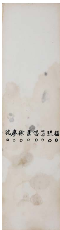
《光緒 12 年楊士驤殿試卷》（局部）