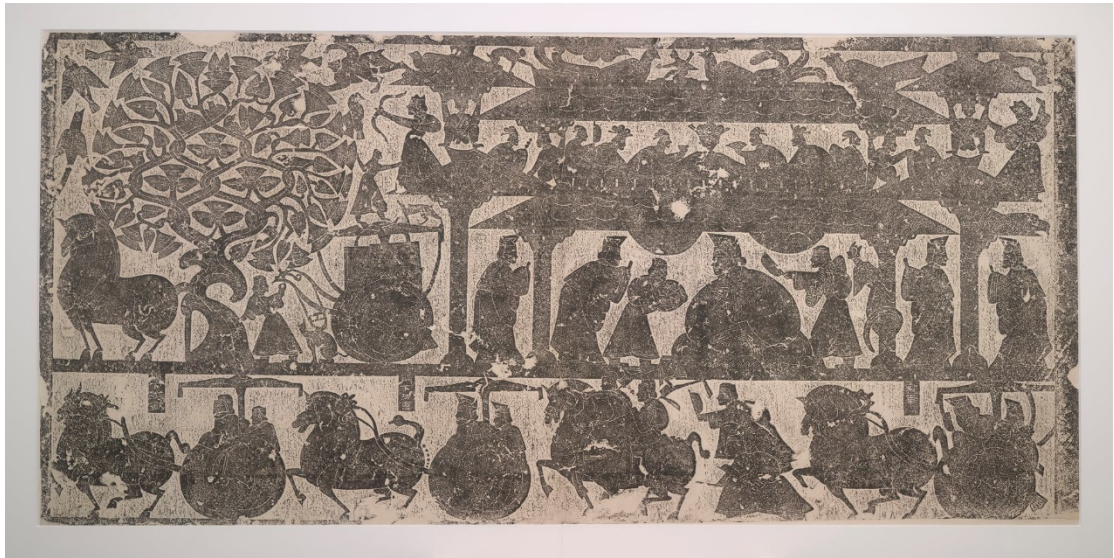
圖二：武梁祠前石室三拓片（史語所藏，12766）

雖說現今不流行「刻繪」圖象，並非我們對圖象已免疫，而是保存圖象及傳遞想法有更多元更豐富的載體。我們身處的時代，圖象運用比起過往，有過之而無不及！圖象的魅力在於，就算同一個畫面，也因觀看者的心路歷程而有各自的解讀，而後產生難以言傳的「意會」。但，就這象徵漢代人生願望的「射爵射侯圖」對於我們現代的多元價值及斜槓人生，又會有何種意義呢？