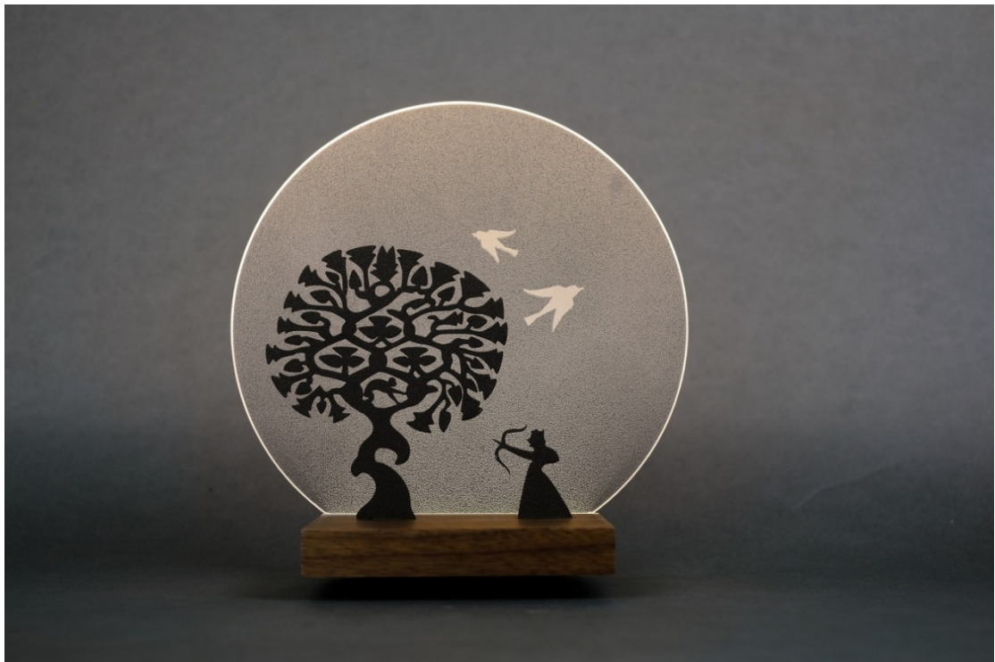
圖三：文物館文創產品《射願情境燈》

雖說現今不流行「刻繪」圖象，並非我們對圖象已免疫，而是保存圖象及傳遞想法有更多元更豐富的載體。我們身處的時代，圖象運用比起過往，有過之而無不及！圖象的魅力在於，就算同一個畫面，也因觀看者的心路歷程而有各自的解讀，而後產生難以言傳的「意會」。但，就這象徵漢代人生願望的「射爵射侯圖」對於我們現代的多元價值及斜槓人生，又會有何種意義呢？