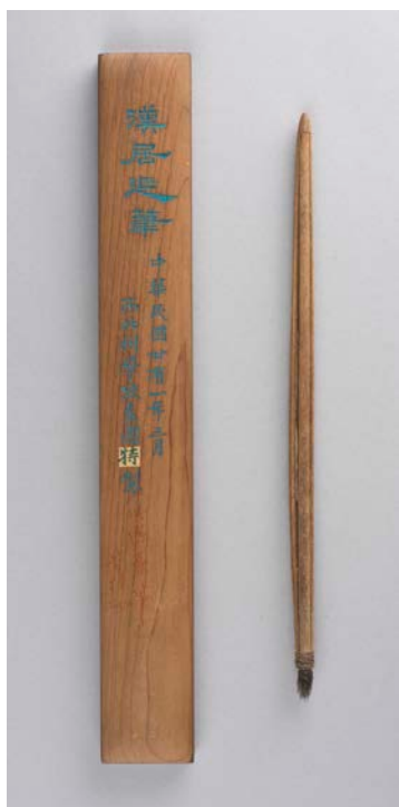
圖二：漢居延筆（木盒後製）