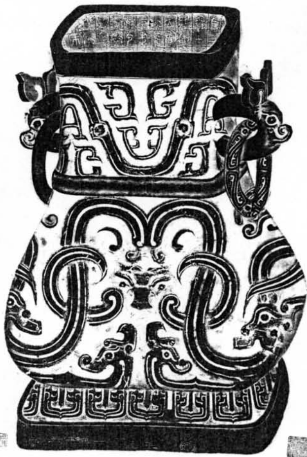
圖三 頌壺全形拓（右上角是實物相片）