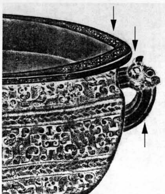
圖五 智君子鑑全形拓局部放大圖