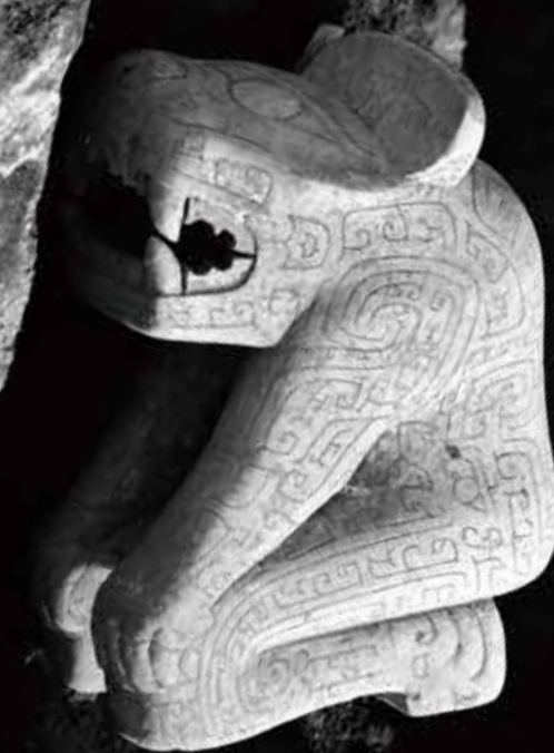
考古發掘出土照片