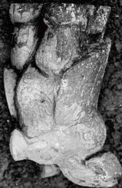
考古發掘出土照片