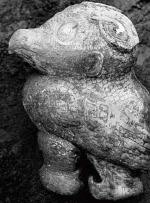
考古發掘出土照片