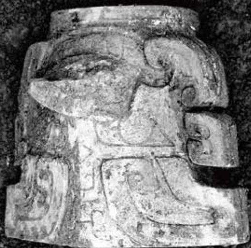
考古發掘出土照片