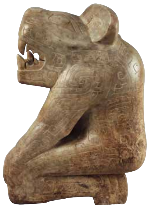
大理石虎首人身立雕