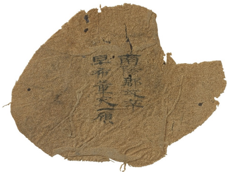
上：帛書 下：帛書局部

在漢代的主要書寫材料，是用竹子（竹簡）或木頭（木牘）製成的，稱為「簡牘」，還有少數是寫在絲織品上的，就叫作「帛書」。帛書在先秦時代就有了，但因為價格昂貴，無法普遍使用，再加上絲織品在地下容易腐朽，不易保存，所以很少出土。因此，在居延出土的兩件帛書彌足珍貴。