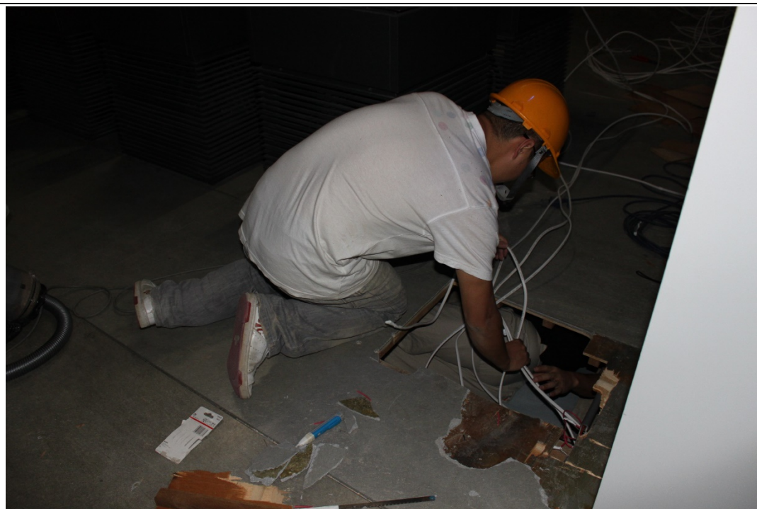
負責營繕的館員正在地板下拉管線