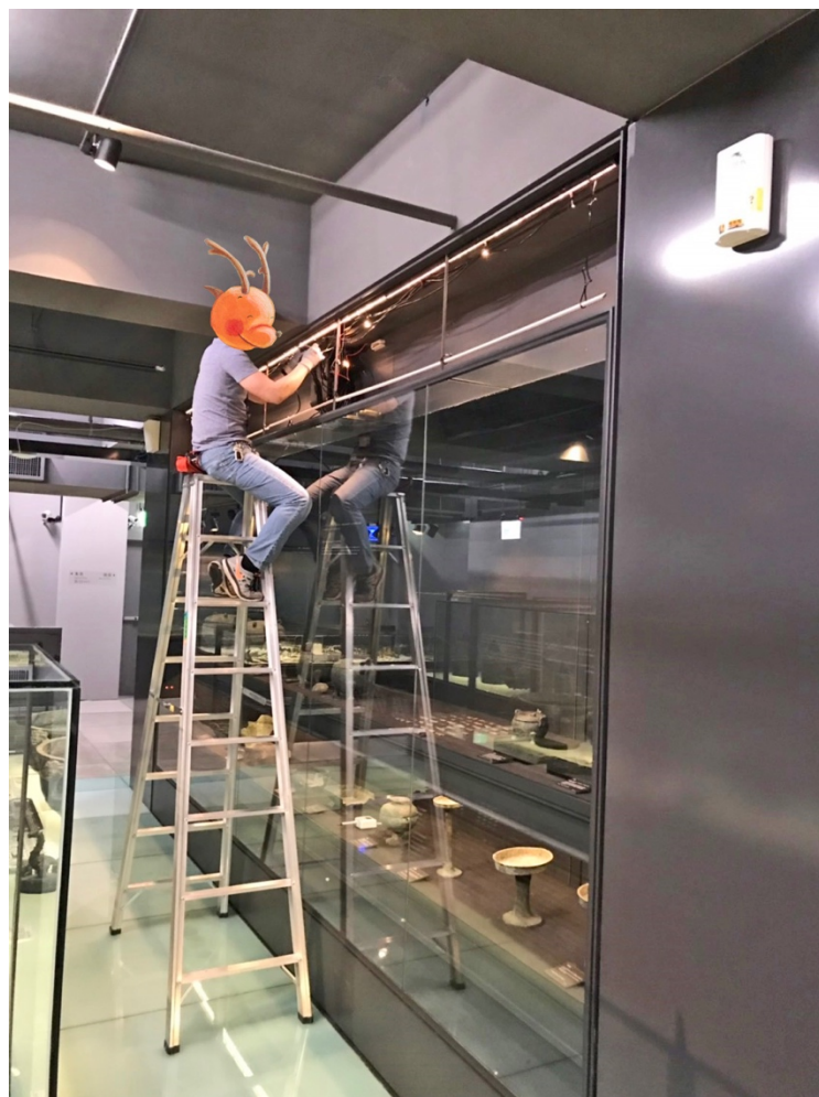
館員利用閉館時間維修展櫃照明設施

所以博物館內的營繕工作不僅是「進行式」也是「未來式」，還兼具「治療」與「預防」目的，且一刻都不能鬆懈。