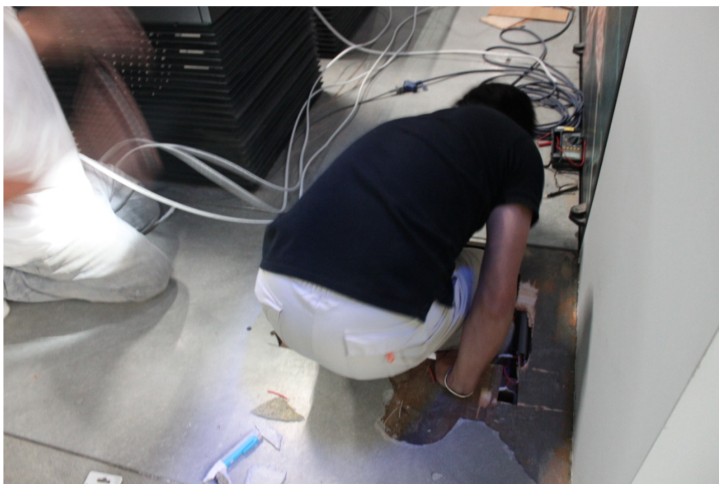
負責營繕的館員準備化身為穿山甲進入地板下，進行維修工作