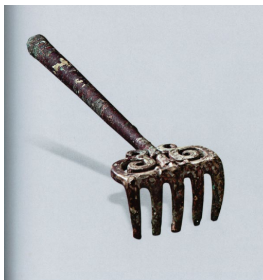
銅炭耙，和另一鏤空炭箕同時出土，中山成公墓。圖像出自山西博物院、河北博物院、河北省文物研究所編，《中山風雲：古中山國文物藝術》（太原：山西人民出版社，2015。）

炭盤為大而淺腹的盤狀器物，長相類似於 東周穿越指南：基礎生活篇（上） 的水盤，但附有提鍊，提鍊把手處可穿木棍，方便在加熱、燙手時仍能移動。