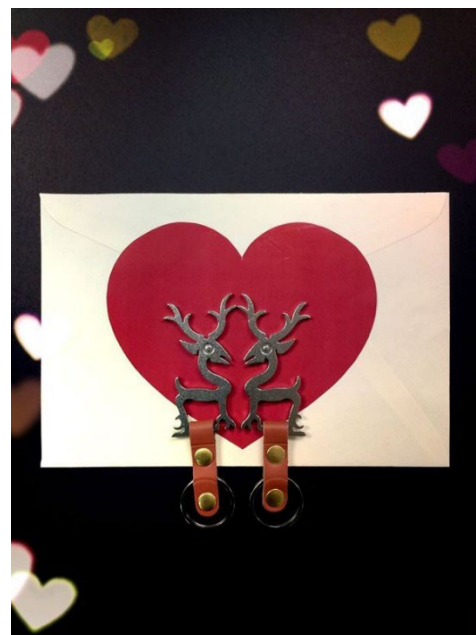
鹿鼎銘文鑰匙圈 ⇨真心恆久遠 雙鹿永流傳