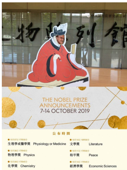
把握任何可以宣傳文物館的機會 ⇨文物館與諾貝爾獎的關係