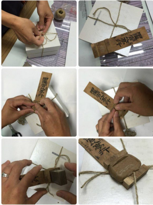
以實際操作來介紹文物 ⇨漢代封檢使用手冊