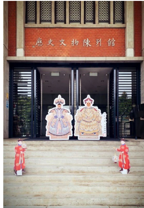
館員拋頭不露面的宣傳展覽 ⇨皇帝皇后 are waiting for you