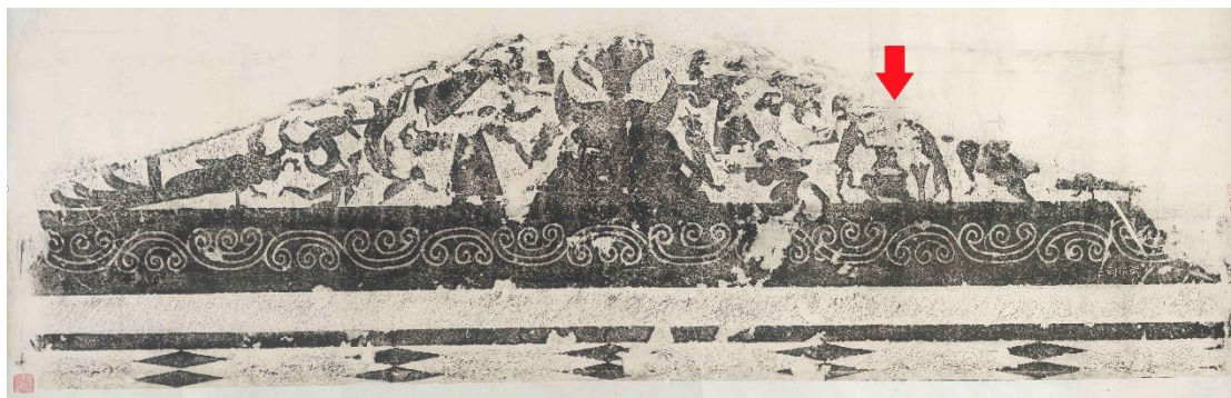
圖一：玉兔就在西王母的左側搗藥（武梁祠三，史語所藏 12763）

月亮上有一隻兔子，因潔白如玉，而被稱為玉兔。有的說牠是嫦娥的化身，因背著后羿偷食了長生不老藥，飛至月亮，被上天懲罰得持玉杵搗藥贖罪；有的說是兔子心善，見不得人受飢，犧牲自我，將自己投身火中，（火烤兔肉！怎麼可以吃小兔兔！）感動天上的神仙，而提拔到月亮上搗製不老藥；還有一說是一位修練千年的兔仙，不捨嫦娥在月亮形單影隻，而將自己最小的兔女兒（不是兔女郎）送至月亮陪伴嫦娥……玉兔搗藥的故事版本有很多，但「玉兔搗藥」的描述最早可見於《漢樂府 董逃行》：「白兔長跪搗藥蝦蟆丸。奉上陛下一玉杵（盤），服此藥可得神仙。」而在漢代畫像上也有牠忙碌的身影。