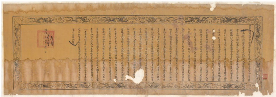
提學官嚴黜劣等舉賢育材敕諭，順治 10 年 8 月 1 日（1653 年 9 月 22 日）， 103937

然而，這項制度在明代後期已出現各種弊端， 上升的階梯——清代士人的科考生活 展覽中一件清初順治十年的敕諭便指出各地學宮的弊端嚴加斥責，例如：各府、州、縣學宮除了正規童子試出身之秀才，尚有賄賂寄學之白丁；此外，還有不通文義之秀才，藉秀才身份結交官府並躲避繇役等問題。因此皇帝敕諭要求嚴格督學，區分等第，黜退不合格者。