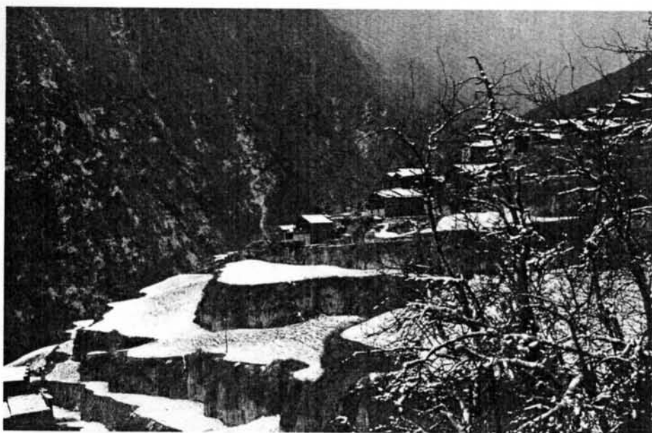
川西羌族村寨的冬景