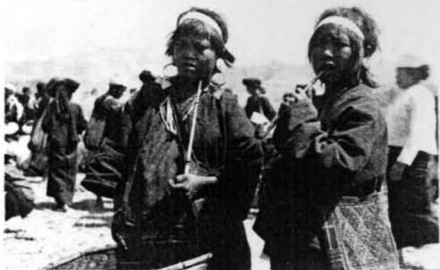
市集中的「野作」(今僂族)

人類常以身體特徵，如膚色、頭髮、眼睛等來區分彼此。在體質無明顯差異的人群間，所謂「身體特徵」也包括對身體的刻意改變，如紋身、拔牙、穿鼻與拉大耳垂等等。在人類社會中，更普遍的是以服飾作為身體的延伸；由服飾來表達人與人間、人群與人群間的認同與區