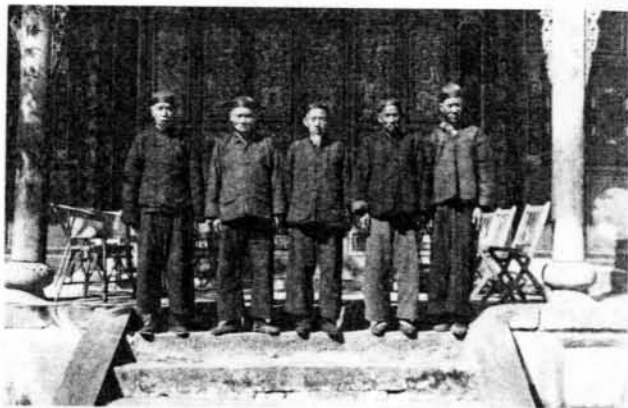
雲南耿馬地區的擺夷（今傣族）頭人裝扮如漢人仕紳

在西南許多族群中，男人穿著比女人漢化也是一普遍現象。至少由清代以來，在許多較漢化的西南地區，土著男性在穿著上便與一般漢人農民沒有多大差別。這主要是因為男人常與外界接觸，著漢裝可避免被視為落後的「蠻子」。在成為少數民族後，由於「傳統」一方面可凝聚族群，另一方面卻代表落後。因此女性穿著本民族傳統服飾，而男性穿著現代服飾，成為當前西南民族地區的普遍現象；這是服飾所反映的性別與族群之複合關係。