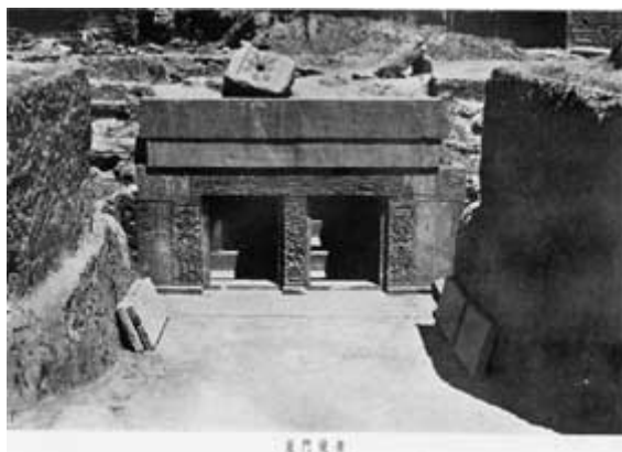
圖一「山東沂南北寨漢畫象石墓」