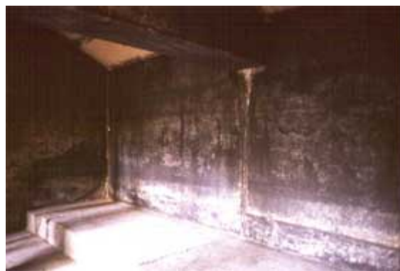
圖四「山東孝堂山石祠堂內部」

圖三中的小房子跟古代農村建築很像，在漢代稱為「祠堂」（參見圖三），裡頭平台是祭台的作用（參見圖四），放上各種供品，從事祭祀活動。屋頂及樑上畫滿裝飾的圖案，這便是畫像石原來的樣子。裡頭會出現大量文字無法傳達的訊息，包括馬車的圖像及人們的生活（參見圖五）。