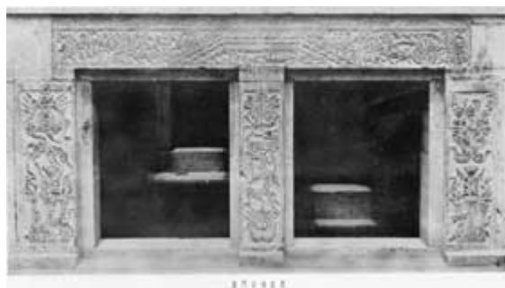
圖二、「山東沂南北寨漢畫象石墓墓門」

以上二圖中的畫象石墓是出土於山東省，時間是東漢晚期，距今約 1,800 年。墓室有柱子及兩個門可以進去，柱子上刻滿圖畫。漢人想像人死後還有另外的生活，因此墓內營造成左室、右室，跟活人所居住的地方沒有兩樣，裡頭有一間間的房間，壁上雕刻滿滿都是畫象。