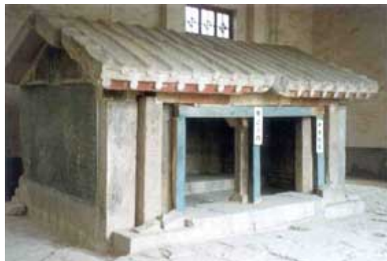
圖三「山東孝堂山石祠堂」