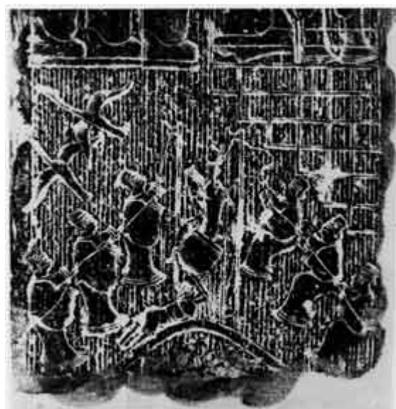
圖十、山東嘉祥劉村洪福院「泗水撈鼎」

意在於不承認秦的正統地位，這是漢代時十分著名的故事。從畫像中可以看到有船、有人在拉繩子，有個龍頭跑出來將繩子咬斷，這也是表達動態的故事。