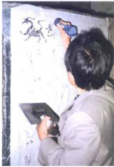
圖七「畫象石拓片的製作實例一」

的部分可以接觸到墨，如此便可將石面上的圖畫拓製下來（參見圖七、圖八）。陳列館拓片區亦有拓片製作的說明。