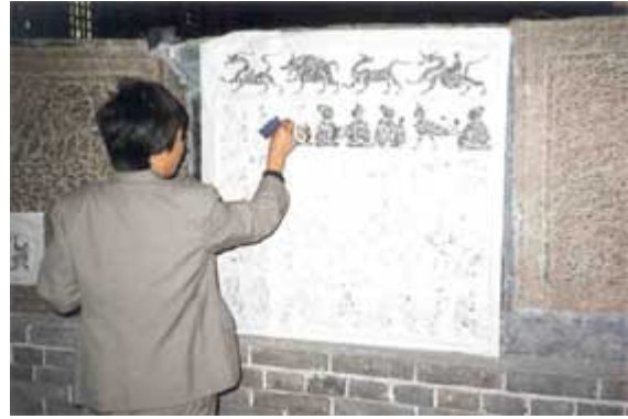
圖八「漢畫象石拓片的製作實例二」