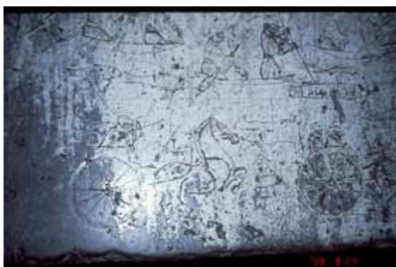
圖五「孝堂山祠堂車馬及人物畫像」

圖三中的小房子跟古代農村建築很像，在漢代稱為「祠堂」（參見圖三），裡頭平台是祭台的作用（參見圖四），放上各種供品，從事祭祀活動。屋頂及樑上畫滿裝飾的圖案，這便是畫像石原來的樣子。裡頭會出現大量文字無法傳達的訊息，包括馬車的圖像及人們的生活（參見圖五）。