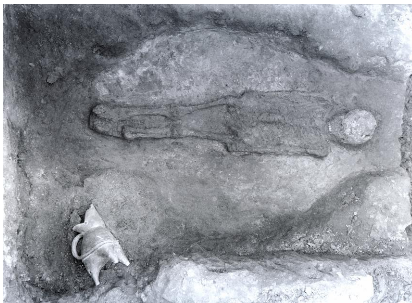
圖一：紅陶鬻出土位置圖

描述：表面塗紅色彩衣。上部前有上仰的流口，後有斜翹的凸出口沿。腹部鼓起，有兩道凸弦紋。下部為三袋足。前胸及流口的尾端兩側，各有一個鉚釘狀突起。腹部把手呈繩索狀。出土於墓主腳旁（圖一）。