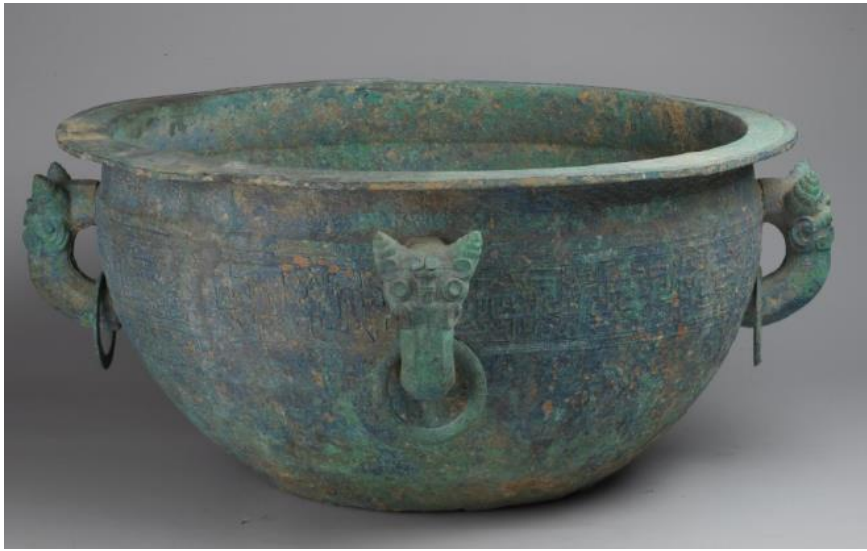
《蟠螭紋鑑》，琉璃閣 60 號墓出土。此鑑口徑寬達 79.2 公分，已是目前出土之鑑中較大者。

《莊子》中記載了件香豔的故事：「靈公有妻三人，同濫（鑑）而浴。」白話翻譯簡單來說，就是：衛靈公與三位老婆一起洗鴛鴦浴。不過，上古的鴛鴦浴可和我們現在想像的不一樣，從出土器物中，鑑的口徑與高度都不足以作為浴缸或澡盆般大小，更不用說好幾個人一起洗澡澡了！因此，正確的使用方式應是以「鑑」盛水，再以斗、勺舀水澆身。