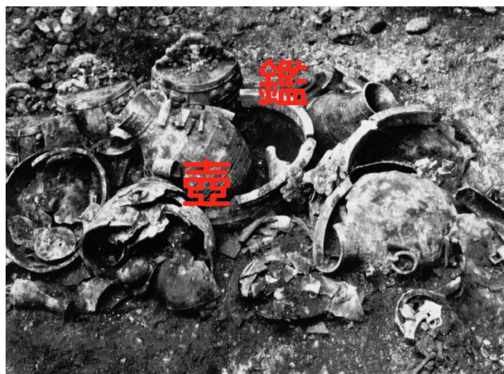
山彪鎮1號墓，壺與鑑出土時照片

目前考古發現最著名的冰箱，以曾侯乙墓出土的《冰鑑缶》為代表。這組鑑缶由方鑑、方缶組成，缶置於鑑內，鑑蓋中央留有方形洞口，以套合方缶口部，方鑑裡面底部設有活動倒栓，可以扣合方缶圈足洞口，使之固定。使用時，內部的方缶盛酒，鑑、缶之間的空隙盛放冰塊。這件器物不僅紋飾華美，設計也十分精巧。(HJW)