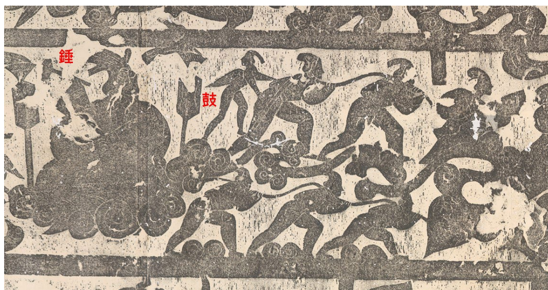
圖二：雷公與他的雲車（圖片擷取自漢畫象拓片「武氏祠後石室三」史語所藏，27427）

說起來漢代畫象的諸神之中，也有位「夠資格」拿錘子，持有雷電交加之力的神仙。他是雷公，不是索爾。