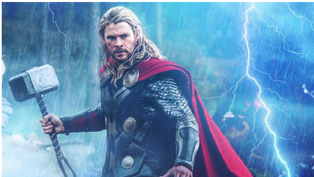
圖一：雷神索爾與他的錘子

索爾（Thor），是北歐神話中掌管戰爭與農業的神。相傳雷雨交加時，索爾就乘馬車出巡，故又稱之「雷神」。近年來因漫威超級英雄電影興起，雷神索爾的霸氣形象，深植人心。而漫威世界裡，他的雷神之錘——妙爾尼爾（Mjölnir）據說是超強的宇宙神器，而唯有「夠資格」的人才能拿起雷神之錘，持雷神之力。