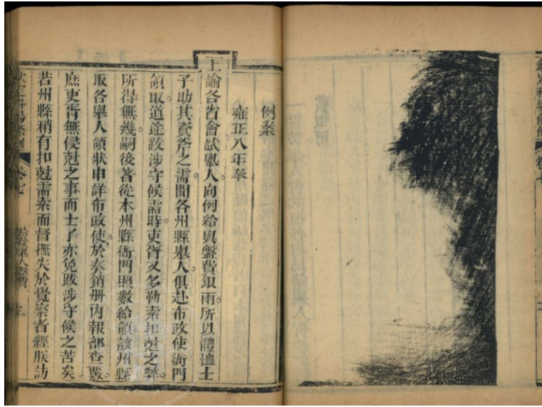
《欽定科場條例》 給發舉人盤費條目。

《公車見聞錄》歸納廣東到北京赴考的五條路線。東邊有三條路線，第一條速度快，從廣州到北京只要 70 天，但「乘車之時多，乘舟之時少，未免勞頓，且費用較多耳。」第二條幾乎沿路搭船，但得看風向，順風時「瞬息百里」，逆風時則須「泊舟以待」充滿不確定性；第三條需花費 3 個月，沿途吳越江山多風景名勝，然「度關不少，換船甚多，縱不惜費用，而未免煩雜矣！」西邊有兩條路線，似乎看起來缺點較多，第一條速度快又省路費，但住店偏小，需常換船，而且船體不大；第二條每日路程長，頗為勞頓。