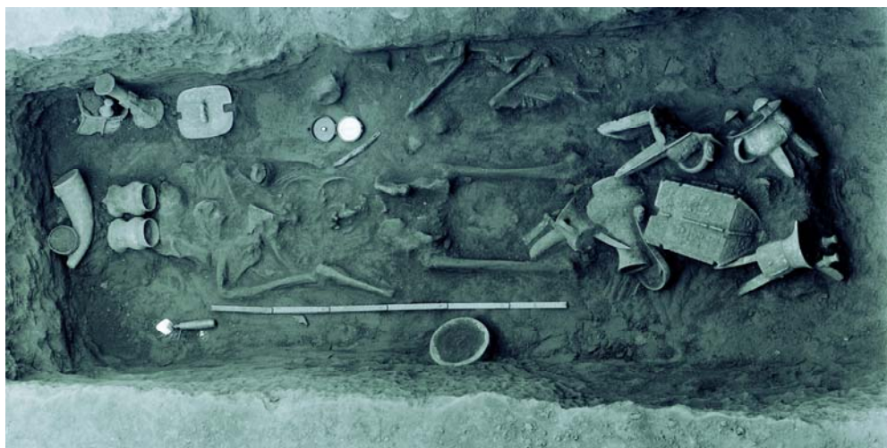
圖一：西北岡 1022 號墓田野照片

西北岡 1022 號墓是一九三四年聖誕節發現的一座「國家寶藏」，出土的文物於二〇〇九年全部列為「國寶」。墓全長 2.3 公尺，寬 0.8-0.9 公尺，是西北岡東區祭祀坑中的一座小墓。出土一套十件的銅酒器：兩爵；一觚（《 乂 》）；兩觶（《 出 》）；兩罍（《 一 丫 》）；一卣（《 一 又 》）；一方彝（《 一 》）；一角形器。其中三節提梁卣和夔龍紋角形器是目前考古僅見的例子。（圖一）